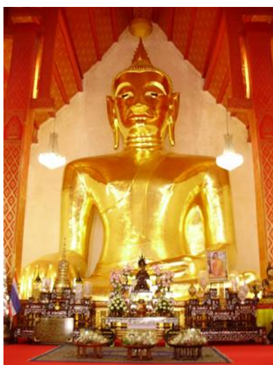
พระเจ้าตนหลวง