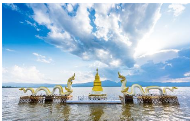
กว๊านพะเยา

"กว๊านพะเยาแหล่งชีวิต ศักดิ์สิทธิ์พระเจ้าตนหลวง บวงสรวงพ่อขุนงำเมือง งามลือเลื่องดอยบุษราคัม"