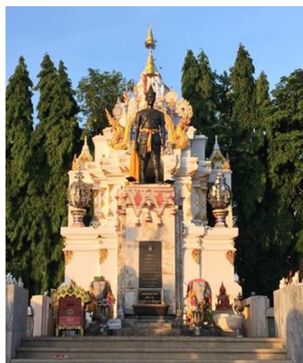
อนุสาวรีย์พ่อขุนงำเมือง