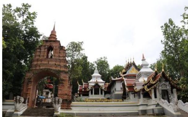
วัดอนาลโยทิพยาราม (ดอยบุษราคัม)